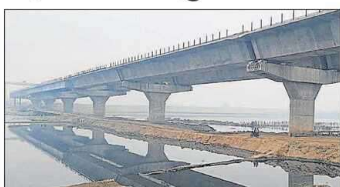
उत्तर प्रदेश और हरियाणा को जोड़ने वाला मंझावली यमुना पुल बनकर तैयार है।

और फरीदाबाद के सांसद कृष्णपाल गुर्जर ने किया था। हरियाणा सरकार पुल और अपनी सड़क का निर्माण तो पूरा कराने जा रही है, लेकिन यूपी के इलाके में सड़क के लिए अभी जमीन का अधिग्रहण नहीं हुआ है। अब यह प्रक्रिया पूरी होने के बाद वाहन फर्रिदा भर सकेंगे। इनको मिलेगा फायदा: पुल और सड़क के चालू होने के बाद ग्रेटर नोएडा के परी चौक से फरीदाबाद पहुंचना आसान होगा। इस यमुना पुल से यमुना एक्सप्रेसवे, ईस्टर्न पैरिफेरल एक्सप्रेसवे, दिल्ली मुंबई एक्सप्रेसवे, दिल्ली हरिद्वार एक्सप्रेसवे को सीधे कनेक्टिविटी मिलेगी।