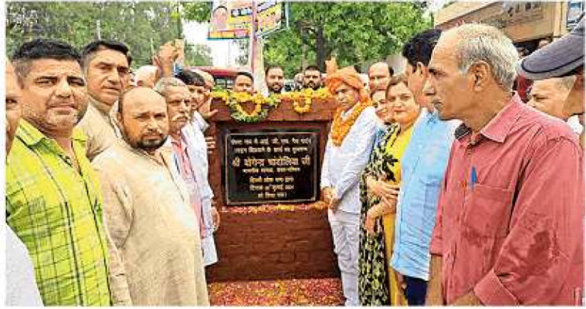
घेवरागांव में पीएनजी के लिए लाइन डालने के कार्य का शुभारंभ करते हुए सांसद योगेंद्र चांदोलिया

के पंजाब खोड़ गांव में भी पीएनजी गैस की पाइप लाइन डालने के कार्य का शुभारंभ किया।