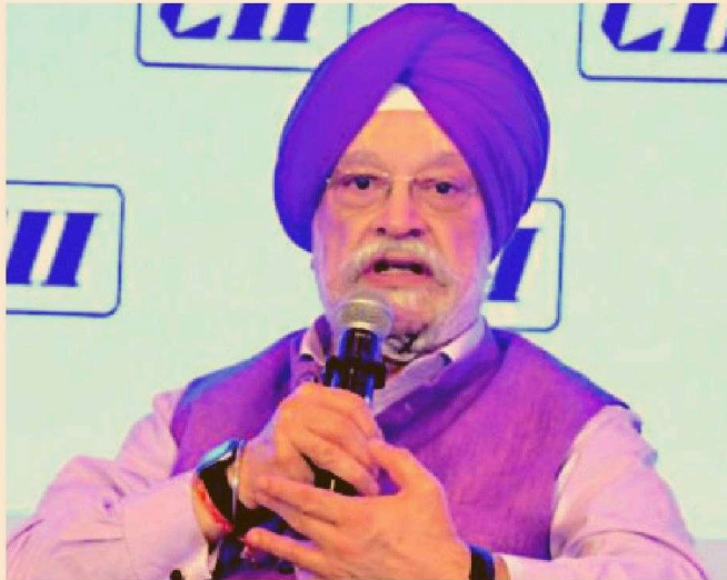
नई दिल्ली में सीआईआई पीएसई समित में केंद्रीय मंत्री हरदीप पुरी।

पुरी ने कहा, 'इस समय वैश्विक बाजार में ब्राजील, गुयाना, कनाडा और अमेरिका जैसे पश्चिमी क्षेत्र से ज्यादा उत्पादन आ रहा है। पिछले सितंबर में जब मैं ह्यूस्टन में गैसटेक में गया था, तो इस सिलसिले में बात की थी। मुझसे कहा गया कि पूर्व