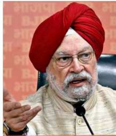
Union Minister for Petroleum and Natural Gas Hardeep Singh Puri

“The global oil demand growth forecast for 2024 is revised down slightly by