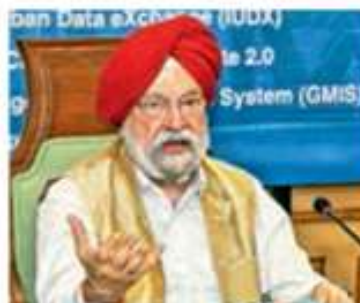
Hardeep Singh Puri

"Countries in the western hemisphere are adding more production which may influence oil producers cartel organisation of the petroleum exporting countries (OPEC) to also raise output to earn more while the era of fossil fuel lasts. Today more production is coming on the global market from the Western Hemisphere. Brazil, Guyana, Canada and the US are adding more production. With more and more oil coming, one expects as a result that the market situation will calm," he said while speaking at CII's 12th PSE Summit here. Statement comes after OPEC+ has cut oil output since 2022.