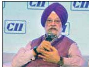
Petroleum and Natural Gas Minister Hardeep Singh Puri

Puri also highlighted the impressive economic growth of public sector enterprises, noting that their net worth surged from Rs 9.5 trillion in 2014 to Rs 17.2 trillion in 2023—an 82 per cent increase. This growth has empowered PSEs to operate with a level of autonomy that increasingly rivals that of private companies, challenging the long-standing perception of