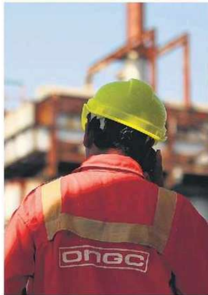
ONGC's stock price is down about 27% from a 52-week high of ₹345 apiece on 13 August.

The good news is that the ramp-up of crude oil production from the