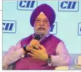
हरदीप पुरी। - प्रेर

भारतीय उद्योग परिसंघ (सीआईआई) के 12वें पीएसई शिखर सम्मेलन में पुरी ने कहा कि पश्चिमी गोलार्ध के देश अधिक उत्पादन कर रहे हैं, जिससे पेट्रोलियम निर्यातक देशों के संगठन 'ओपेक' को भी उत्पादन बढ़ाने के लिए प्रभावित किया जा सकता है। इससे वे अधिक कमाई कर सकेंगे। तेल कीमतों में उतार-चढ़ाव अपनी जरूरतों को पूरा करने के लिए आयात पर निर्भर अर्थव्यवस्थाओं को परेशान करता है क्योंकि उन्हें न केवल ईंधन खरीदने पर अतिरिक्त खर्च करना पड़ता है, बल्कि इससे मुद्रास्फीति भी आती है जो उनके लोगों