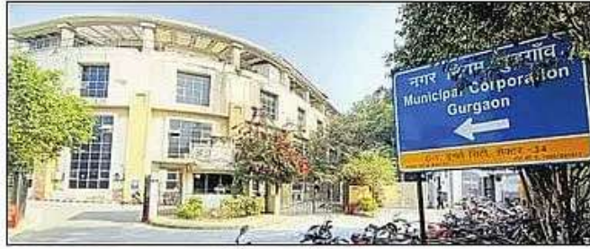
नगर निगम कार्यालय। संवाद

निगम ने घरों से कूड़ा उठान व सड़क सफाई का काम निजी एजेंसियों से कराया है, लेकिन कूड़ा निस्तारण को लेकर कोई योजना नहीं बनी। 2010 में निगम ने बंधवाड़ी में एक कूड़ा निस्तारण को लेकर प्लांट स्थापित किया था,