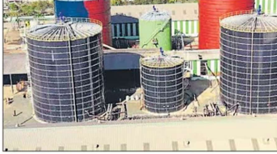
इंदौर में लगा बायो गैस प्लांट। ● फाइल फोटो

प्लांट स्थापित करने, डिजाइन, निर्माण, वित्त, संचालन के आधार पर संपीड़ित बायो-गैस उत्पादन संयंत्रों की स्थापना के लिए निगम द्वारा सलाहाकार एजेंसी को नियुक्त किया जाएगा। इसके लिए निगम ने टेंडर लगाकर निजी सलाहाकार एजेंसियों के आवेदन मांगे हैं। इन प्लांट को स्थापित करने के लिए निगम ने जगह