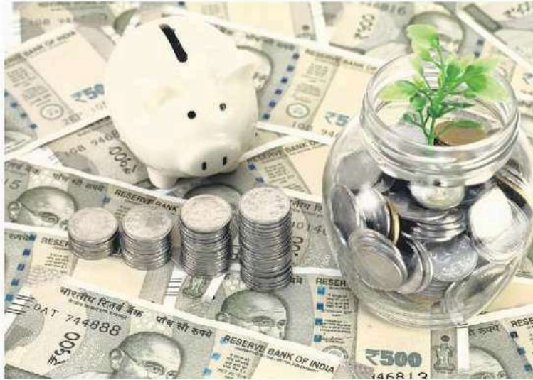
The focus is on getting PSUs more professionally run, so that their decisions be more board-driven.

"It's also a question of how they're utilizing the financial resources they have available to