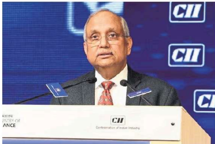
Confederation of Indian Industry director general Chandrajit Banerjee.

"Domestic consumption has been critical to India's growth story, but inflationary pressures have somewhat eroded the purchasing power of consumers. Government interventions could focus on enhancing disposable incomes and stimulating spending to sustain economic momentum. Persistent food inflationary pressures particularly impinge upon low-income rural households who allocate larger share to food in their consumption basket," said Chandrajit Banerjee, director general, CII. He further noted that while recent quarters have shown promising signs of recovery in rural consumption, targeted government inter-