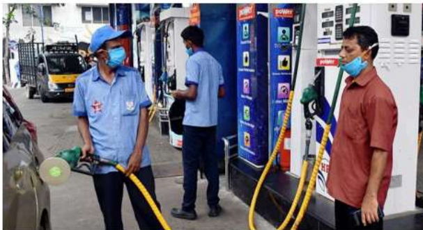
THE IMPACT. Lowering excise duty on fuel would help reduce overall inflation and increase disposable incomes

The industry body recommended reducing excise duties on petrol and diesel, pointing out that fuel prices heavily influence inflation and household spending patterns.