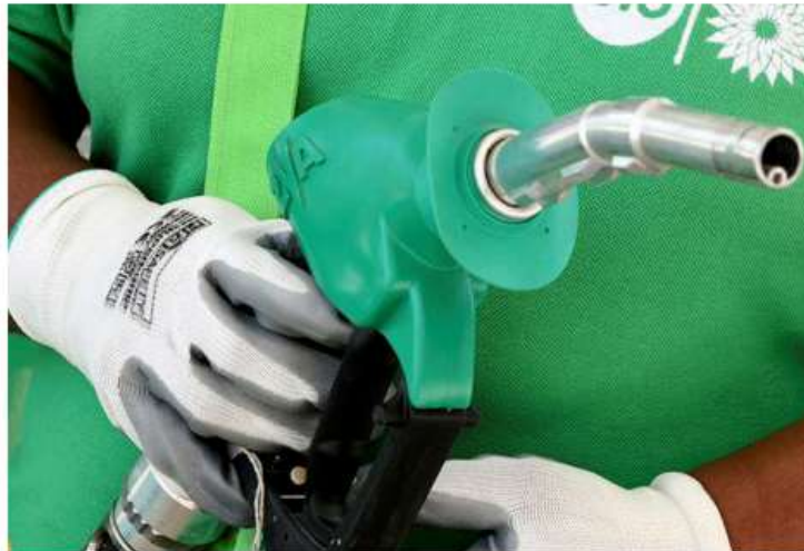
JOINING HANDS. The Jio-bp joint venture is focused on creating the maximum number of EV charging stations.

In addition to its significant investments in the upstream and downstream side of businesses, in India, bp is one of the first global energy players to move into the green space. Despite the global strategy shift, the energy major's India business is working with ease, an official in the know told businessline .