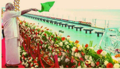
तमिलनाडु को 8,300 करोड़ रुपये की परियोजनाओं की सौगात

सरकार के अनुसार, रामेश्वरम को मुख्य भूमि से जोड़ने वाला यह पुल भारतीय इंजीनियरिंग का एक उल्लेखनीय कारनामा है और इसे 700 करोड़ रुपये से अधिक की लागत से बनाया गया है। लगभग 2.08 किलोमीटर लंबे इस पुल में 99 'स्पैन' और 72.5 मीटर लंबा 'वर्टिकल लिफ्ट स्पैन' है, जिसे 17 मीटर तक उठाया जा सकता है।