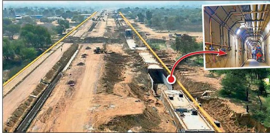
शहर के सेक्टर-36 में एक हजार से अधिक एकड़ में चल रहा है ग्लोबल सिटी का काम

के एरिया में एक हजार एकड़ में ग्लोबल सिटी का काम चल रहा है। यहां रोड निर्माण का काम 60 फीसदी पूरा हो चुका है। इस सिटी के अंदर ही रेजिडेंशल, कमर्शल, मेडिकल, एजुकेशन की सुविधा होगी। यहीं एसटीपी और डब्ल्यूटीपी की सुविधा होगी। यहां रहने वाली जनसंख्या के अनुसार इनकी क्षमता होगी।