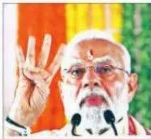
Prime Minister Narendra Modi speaks after inaugurating the Pamban bridge, in Tamil Nadu on Sunday

Noting that former President APJ Abdul Kalam, “whose life demonstrated how science