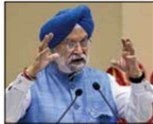
Petroleum & Natural Gas Minister Hardeep Singh Puri

India imposed a windfall profit tax on July 1, 2022 joining a growing number of nations that tax super normal profits of energy companies. At that time, export duties of Rs 6 per litre ($12 per barrel) each were levied on petrol and ATF and