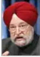
हरदीप सिंह पुरी

नई दिल्ली, (पंजाब केसरी) : भारत के पेट्रोलियम और प्राकृतिक गैस मंत्री हरदीप सिंह पुरी ने बुधवार को उद्योग जगत के दिग्गजों और ऑयल मार्केटिंग कंपनियों (ओएमसीएस) के चेयरमैन और प्रबंध निदेशकों से मुलाकात की। यह बैठक फेडरेशन ऑफ इंडियन पेट्रोलियम इंडस्ट्री (एफआईपीआई) द्वारा आयोजित की गई थी और इसमें हाल ही में पारित ऑयलफील्ड्स (रेगुलेशन एंड डेवलपमेंट) संशोधन विधेयक, 2024 के प्रभावों पर चर्चा हुई।