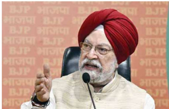
Union Minister of Petroleum and Natural Gas Hardeep Singh Puri

The Bill is part of the government's reforms agenda to make it easier to find and produce crude oil (which is refined into fuels like petrol and diesel) and natural gas (which is used to generate power, make fertiliser or turn into cooking gas and CNG). It decriminalised some of the pro-