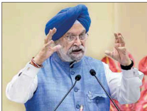
Union Petroleum and Natural Gas Minister Hardeep Singh Puri

"How did it happen? The cost of petrol at the extraction point, then add insurance cost, freight, margin, Centre's excise