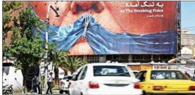
Anti-US billboard, depicting Trump & Strait of Hormuz, in Tehran

India, Australia, Japan and the US are united by a common vision for a free and open Indo-Pacific, underpinned by robust economic and energy systems, according to a statement on the energy security initiative issued after the foreign ministers' meeting.