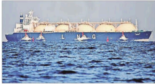
The cargo is about a day's worth of India's LNG imports. REUTERS REPRESENTATIONAL IMAGE